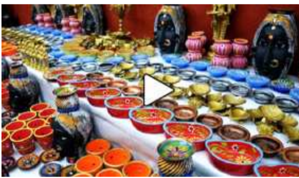
ಬೆಳಕಿನ ಹಬ್ಬಕ್ಕಾಗಿ ವಿವಿಧ ರೀತಿಯ ಹಣತೆಗಳು ಮಾರುಕಟ್ಟೆಯಲ್ಲಿ ಮಾರಾಟಕ್ಕೆ ಸಿದ್ಧವಿರುವುದು.