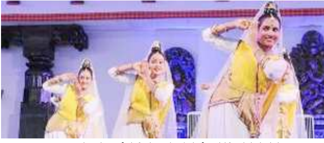
ಆಲ್ಯಾಸ್ ಮೂಡುಬಿದಿರೆಯಲ್ಲಿನ ಕಾರ್ಯಕ್ರಮವೊಂದರಲ್ಲಿ ನೃತ್ಯದ ದೃಶ್ಯ