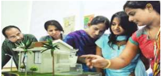
ಮಳೆಯ ನೀರು ಶೇಖರಣೆ ಬಗ್ಗೆ ವಿಧಾನಸೌಧದಲ್ಲಿ ಮಹಿಳೆಯರು ಮಾಡಲ್ ವೀಕ್ಷಿಸುತ್ತಿರುವುದು.

ಚಾಮರಾಜನಗರದ ನೆಹರೂ ಯುವ ಕೇಂದ್ರವು ಯುವ ಕ್ಷೇತ್ರದಲ್ಲಿ ಅತ್ಯುತ್ತಮ ಕಾರ್ಯ ನಿರ್ವಹಿಸುತ್ತಿರುವ ಯುವ ಸಂಘಟನೆ, ಮಹಿಳಾ ಮಂಡಳಿಗೆ ಪ್ರಶಸ್ತಿ ನೀಡಲು ಅರ್ಜಿ ಆಹ್ವಾನಿಸಿದೆ. ಮಾಹಿತಿಗಾಗಿ ದೂ: 08226- 222120 ಸಂಪರ್ಕಿಸಲು ಕೋರಿದೆ.