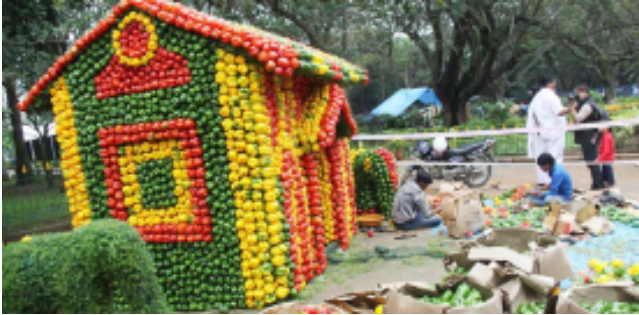
ಬೆಂಗಳೂರಿನ ಕಬ್ಬನ್ ಪಾರ್ಕ್‌ನಲ್ಲಿ ದಷ್ಟು ಮೋಸಿಕಾಯಗಳಿಂದ ನಿರ್ಮಿಸಿದ ಮನೆ