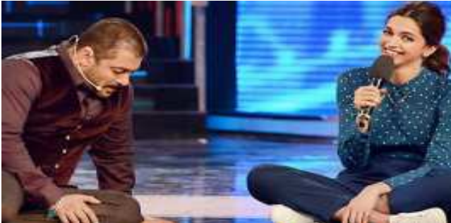
ತಮಾಷ ಬೆಗ್‌ಬಾಸ್ ೯ರಲ್ಲಿ ಹಾಸ್ಯದ ತುಣುಕು ದೀಪಿಕಾ ಪಡುಕೋಣಿಯಿಂದ