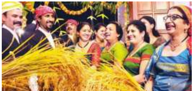
ಕೊಡವ ಸಮಾಜ ಬೆಂಗಳೂರಿನಲ್ಲಿ ಹುತ್ತರಿ ಹಬ್ಬದ ಆಚರಣೆಯ ನೋಟ