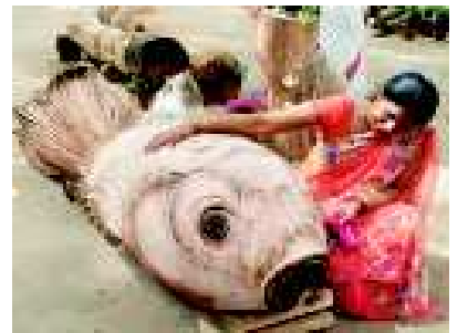
ಬೆಂಗಳೂರು ಲಾಲ್‌ಬಾಗ್‌ನಲ್ಲಿ ಮರದ ಕೊರಡಿನಲ್ಲಿ ಕೆತ್ತಿರುವ ಮೀನನ್ನು ಕುತೂಹಲದಿಂದ ನೋಡುತ್ತಿರುವ ಮಹಿಳೆ

ಇದು ನಿಮ್ಮ ಮಹಿಳಾ ಪತ್ರಿಕೆ ಪ್ರೋತ್ಸಾಹಿಸಿ, ಬೆಳೆಸಿ. 9379777793