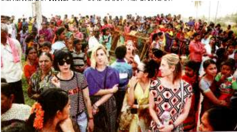
ಬೆಂಗಳೂರು ಮೈಸೂರು ರಸ್ತೆಯ ಸಿದ್ದಲಿಂಗಪುರದಲ್ಲಿ ಮೈ ನವಿರೇಳಿಸುವ ಜಾನುವಾರು ಗಳ ಕಿಚ್ಚು ಹಾಯಿಸುವ ಕಾರ್ಯಕ್ರಮವನ್ನು ಕುತೂಹಲದಿಂದ ವೀಕ್ಷಿಸಲು ನೆರೆದಿದ್ದ ವಿದೇಶಿ ಯರು ಹಾಗೂ ಸ್ಥಳೀಯರು.