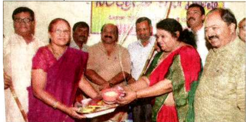
ಮೈಸೂರಿನ ಕಪಾಪ ನ ಕಛೇರಿಯಲ್ಲಿ ಆಯೋಜಿಸಿದ್ದ ಸಂಸ್ಕೃತಿ ಕವಿಗೋಷ್ಠಿಯನ್ನು ಎಳ್ಳು ಬೆಲ್ಲ ವಿತರಿಸುವ ಮೂಲಕ ಗಣ್ಯರು ಉದ್ಘಾಟಿಸಿದರು.