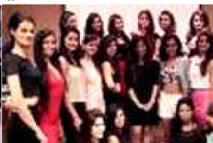
ಕ್ಯಾಂಪಸ್ ಪ್ರಿನ್ಸ್ ಮೇಕಪ್ ಸೆಷನ್ಸ್