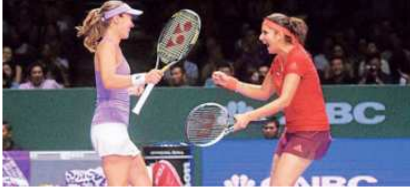
ವಿಶ್ವದ ನಂ. 1 ಮಹಿಳಾ ಜೋಡಿಯಾದ ಸಾನಿಯಾ ಮತ್ತು ಹಿಂಗಿಸ್ ಇತ್ತೀಚೆಗೆ ನಡೆದ ನ್ಯೂ ಸೌತ್ ವೆಲ್ಸ್ ಸೆಂಟರ್‌ನಲ್ಲಿ ಮುಕ್ತಾಯವಾದ ಪಂದ್ಯವಳಿಯಲ್ಲಿ ಫ್ರಾನ್ಸ್‌ನ 3 ನೇ ಶ್ರೇಯಾಂಕಿತ ಜೋಡಿಯನ್ನು 1-6, 7-5, 10-5 ಸೆಟ್‌ಗಳಿಂದ ಗೆಲುವು ಪಡೆದರು. ಸಾನಿಯಾ ಹಿಂಗಿಸ್ ಜೋಡಿ ಸತತ 30 ನೇ ಗೆಲುವನ್ನು ಕಂಡಿದ್ದು ಸಿಡ್ನಿ ಇಂಟರ್ ನ್ಯಾಷನಲ್ ಟೆನ್ನಿಸ್ ಪಂದ್ಯವಳಿಯಲ್ಲಿ ಚಾಂಪಿಯನ್ ಆದರು.