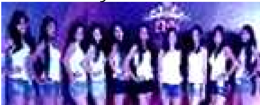
FBB ನಾಗಪುರದಲ್ಲಿ ನಡೆದ ಆಡಿಷನ್