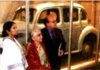
75ನೇ ಸ್ಮರಣೆ ವರ್ಷಾಚರಣೆ