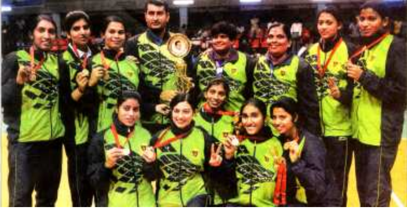
ಬೆಂಗಳೂರಿನಲ್ಲಿ ಕಳೆದ ವಾರ ಮುಕ್ತಾಯವಾದ ೬೪ನೇ ರಾಷ್ಟ್ರೀಯ ವಾಲಿಬಾಲ್ ನ ಚಾಂಪಿಯನ್ ಶಿಪ್‌ನ ವಿಭಾಗದಲ್ಲಿ ಪ್ರಶಸ್ತಿಗೆದ್ದ ರೈಲ್ವೆಸ್ ತಂಡ ಋಷಿಯಿಂದಿರುವ ಕ್ಷಣ ಸಾನಿಯಾ ಹಿಂಗಿಸ್‌ಗೆ ಒಲಿದ ವಿಜಯಲಕ್ಷ್ಮಿ