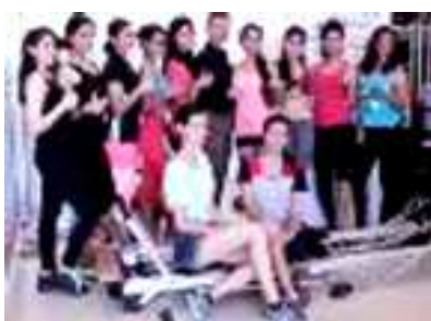
ಕ್ಯಾಂಪಸ್ ಪ್ರಿನ್ಸ್ ಫಿಟ್‌ನೆಸ್ ಸೆಷನ್ಸ್