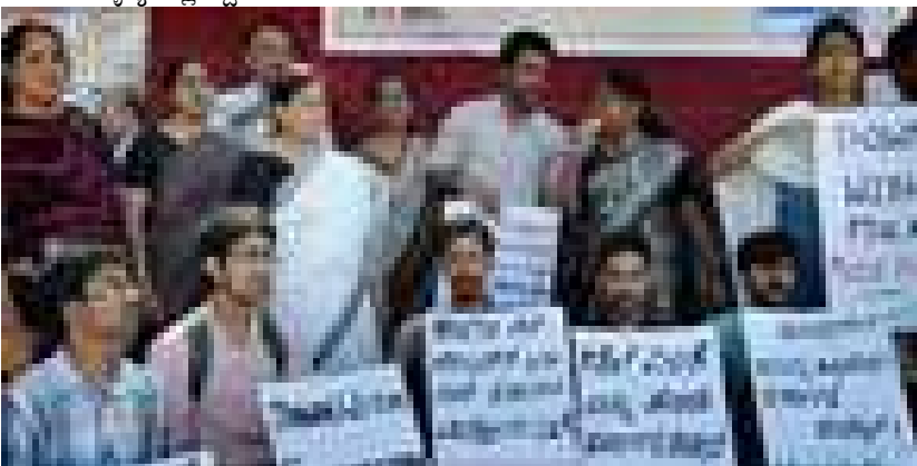
ಮೈಸೂರು ಬ್ಯಾಂಕ್ ಸರ್ಕಲ್ ಬಳಿ ಹಾಲಿನ ದರ ಏರಿಕೆ ಬಗ್ಗೆ ಪ್ರತಿಭಟಿಸುತ್ತಿರುವ ನಾಗರಿಕರು.

ಇದು ನಿಮ್ಮ ಮಹಿಳಾ ಪತ್ರಿಕೆ ಪ್ರೋತ್ಸಾಹಿಸಿ, ಬೆಳೆಸಿ. 9379777793