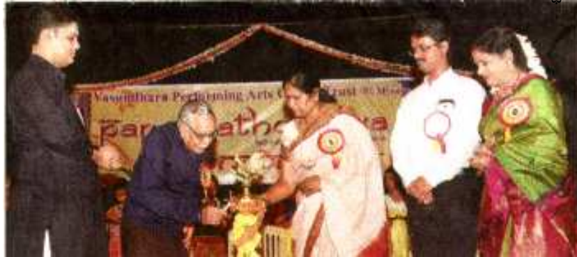
ಪಾರಂಗೋತ್ಸವ - 2016 ವಸುಂಧರಾ ಪ್ರದರ್ಶನ ಕಲೆಗಳ ಕೇಂದ್ರ ವಿಪಿಎಸಿಎಸ್ ಟ್ರಸ್ಟ್‌ನಿಂದ ನಗರದ ಜಗನ್ನೋಹನ ಅರಮನೆಯಲ್ಲಿ ಆಯೋಜಿಸಿರುವ ಶಾಸ್ತ್ರೀಯ ಸಂಗೀತ ಮತ್ತು ನೃತ್ಯದ ಪಾರಂಗೋತ್ಸವ 2016ಕ್ಕೆ ಸೋ. ಸಗಾ ಶೇಖರ್ ಚಾಲನೆ ನೀಡಿದರು.