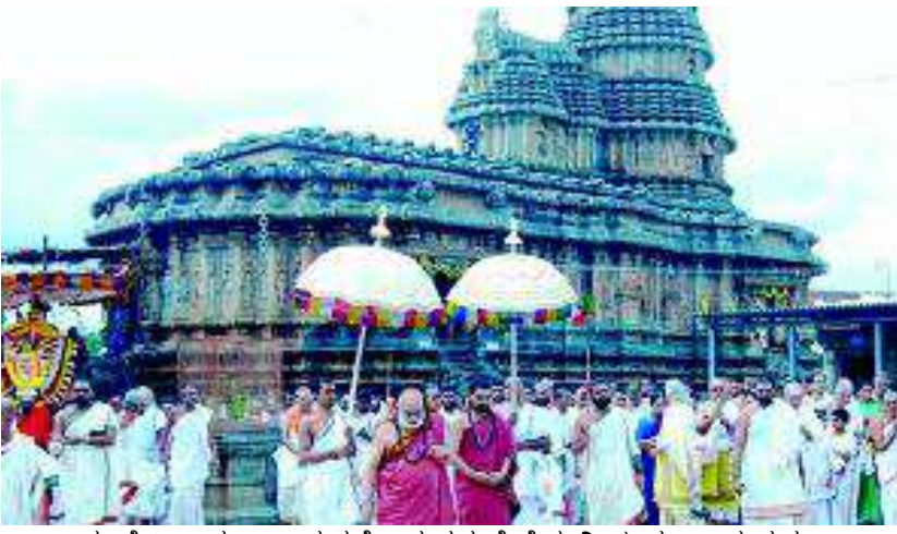
ಶೃಂಗೇರಿ ಶಾರದಾ ಪೀಠ ರಥೋತ್ಸವದ ವೇಳೆಯಲ್ಲಿ ಕಂಡು ಬಂದ ದೃಶ್ಯ.

ಮಹಿಳಾ ಸಂಸ್ಕೃತಿ ಹಬ್ಬದ ಪ್ರಯುಕ್ತ ಪುಣ್ಯಕ್ಷೇತ್ರಗಳಲ್ಲಿ ನಡೆದ ಪೂಜಾ ಕಾರ್ಯಕ್ರಮ