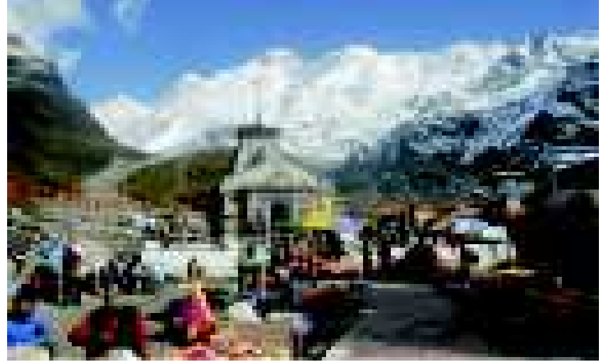
ಕೇದಾರನಾಥ ದೇವಸ್ಥಾನದ ಒಂದು ಮನಮೋಹಕ ದೃಶ್ಯ.