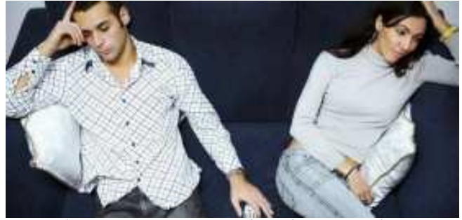
ಜೀವನವೆಂಬುದು ಒಂದು ಮಹಾಸಾಗರ. ಮುನಿಸ, ಕೋಪ, ಬೇಜಾರುಗಳಿಂದ ಪ್ರಯೋಜನವಿಲ್ಲ ಹೊಂದಾಣಿಕೆಯಿಂದ ಜೀವನ ಸುಖವುಯು