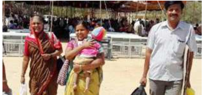
ರಾಯಚೂರು ಜಿಲ್ಲೆ ಲಿಂಗಸೂರು ತಾಲ್ಲೂಕಿನಲ್ಲಿ ಜಿ.ಪಂ. ಹಾಗೂ ತಾ.ಪಂ. ಚುನಾವಣಾ ಕಾರ್ಯಕ್ಕೆ ಭಾಗಿಯಾಗಿರುವ ನೌಕರರು ಮಗುವೊಂದಿಗೆ ಇರುವ ಮಹಿಳೆಯನ್ನು ರಿಸರ್ವ್‌ನಲ್ಲಿಡಬಹುದಿತ್ತಲ್ಲವೇ.