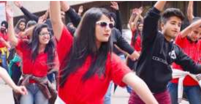
ಶಿಕ್ಷಣವೇ ನಡೆಯುವ ಡಿಎವಿ ವಿದ್ಯಾರ್ಥಿಗಳ ಕಾರ್ಯಕ್ರಮದ ಪ್ರಚಾರಕ್ಕಾಗಿ ಪಂಜಾಬ್ ವಿವಿ ವಿದ್ಯಾರ್ಥಿಗಳು ಚೆಂಡೀಗಡದಲ್ಲಿ ಪ್ಲಾಝ್ ಮಾರ್ಬ್ ಆಯೋಜಿಸಿದ್ದರು.