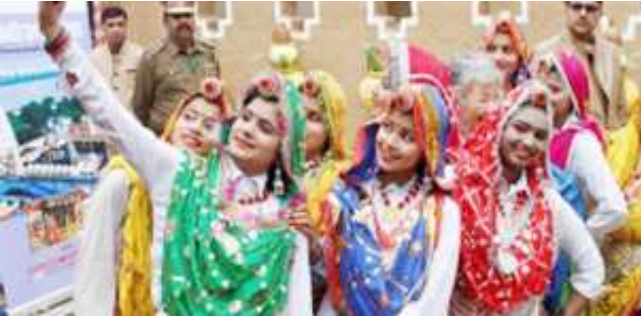
ಫರಿದಾಬಾದ್‌ನಲ್ಲಿ 30ನೇ ಅಂತರರಾಷ್ಟ್ರೀಯ ಸೂರಜ್ ಕುಂಡ ಕ್ರಾಫ್ಟ್‌ಮೇಳದಲ್ಲಿ ಹರಿಯಾಣದ ಕಲಾವಿದರು