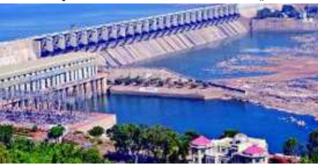
ವಿಜಯಪುರ ಜಿಲ್ಲೆಯಲ್ಲಿರುವ ಅಲಮಟ್ಟಿ ಜಲಾಶಯದಲ್ಲಿ ಬತ್ತಿ ಹೋಗಿರುವ ನೀರಿನ ದೃಶ್ಯ.