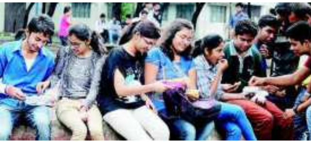
ಕಾಲೇಜಿನಲ್ಲಿ ಪಾಠ ಮುಗಿದ ಮುಂದೆ ಪರೀಕ್ಷೆಗೆ ಏನು ಮಾಡಬೇಕೆಂದು ಚರ್ಚೆಯಲ್ಲಿರುವ ವಿದ್ಯಾರ್ಥಿಗಳು.