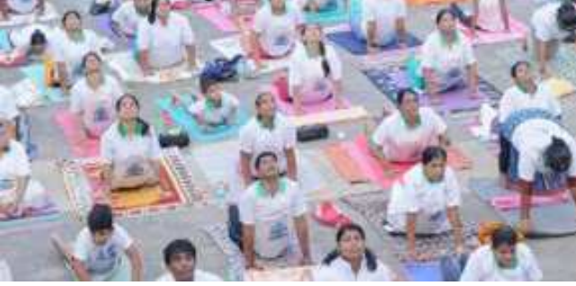
ಪತಂಜಲಿ ಯೋಗ ಶಿಕ್ಷಣ ಸಮಿತಿ ಮಂಗಳೂರಿನಲ್ಲಿ ರಥಸಪ್ತಮಿ ಪ್ರಯುಕ್ತ ಸೂರ್ಯ ನಮಸ್ಕಾರ ಆಯೋಜಿಸಿತ್ತು.