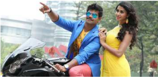
ಟೈಸನ್ ಚಿತ್ರದಲ್ಲಿ ಕಂಡು ಬರುವ ದೃಶ್ಯ