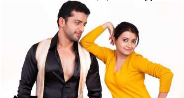
ಮರೆಯಲಾರ ಕನ್ನಡ ಚಲನ ಚಿತ್ರದಲ್ಲಿ ಬರುವ ಮತ್ತೊಂದು ಸನ್ನಿವೇಶದ ಚಿತ್ರ.