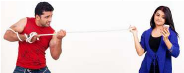
ಮರೆಯಲಾರ ಕನ್ನಡ ಚಲನ ಚಿತ್ರದಲ್ಲಿ ಬರುವ ಒಂದು ದೃಶ್ಯ