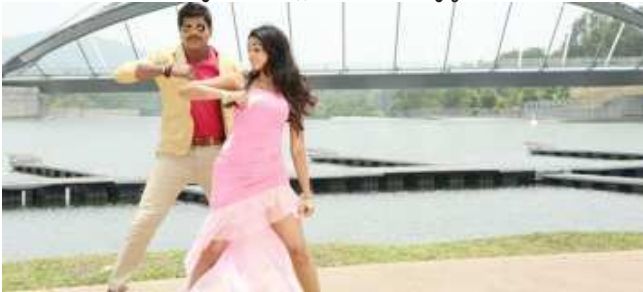
ಟೈಸನ್ ಚಿತ್ರದಲ್ಲಿ ಬರುವ ಮತ್ತೊಂದು ಸನ್ನಿವೇಶದ ಚಿತ್ರ.