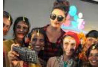
ನಟಿ ರಾಗಿಣಿ ದ್ವಿವೇದ್ ಬೆಂಗಳೂರು ಯುವ ಜನೋತ್ಸವದಲ್ಲಿ ಪಾಲ್ಗೊಂಡು ಯುವತಿಯರೊಂದಿಗೆ ಸಂಭ್ರಮಿಸುತ್ತಿರುವ ದೃಶ್ಯದ ಫೋಟೋ

ನಗರದ ಶ್ರೀ ವಾಣಿಜ್ಯ ಮತ್ತು ಕಂಪ್ಯೂಟರ್ ವಿದ್ಯಾಸಂಸ್ಥೆಗೆ ಕರ್ನಾಟಕ ಪ್ರೌಢಶಾಲಾ ಪರಿಷತ್ ಮಂಡಳಿ ಜನವರಿಯಲ್ಲಿ ನಡೆಸಿದ ಟೈಪಿಂಗ್ ಪರೀಕ್ಷೆಯಲ್ಲಿ 8 ಡಿಸ್ಟಿಂಕ್ಷನ್ ದೊರೆತಿದೆ.