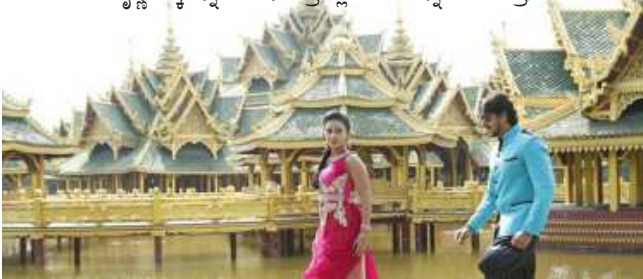
ಕೃಷ್ಣರುಕ್ಕು ಕನ್ನಡ ಚಲನ ಚಿತ್ರದಲ್ಲಿ ಬರುವ ಮತ್ತೊಂದು ಸನ್ನಿವೇಶದ ಚಿತ್ರ.