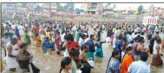
ತಮಿಳುನಾಡಿನ ಕುಂಭಕೋಣಂನಲ್ಲಿ ಮಹಾಮಹಾ ತೀರ್ಥವಾರಿ ಉತ್ಸವ ದಕ್ಷಿಣಭಾರತದ ಕುಂಭಮೇಳವೆಂದೆ ಪ್ರಖ್ಯಾತಿ