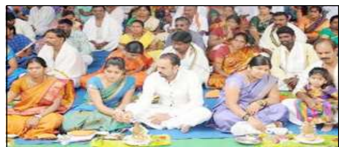
ಮೈಸೂರಿನ ಜೆಎಸ್‌ಎಸ್ ಬಡಾವಣೆಯ ರಾಜಕುಮಾರ ರಸ್ತೆ ಬಳಿ ನಡೆದ ಸತ್ಯನಾರಾಯಣಮೇಳಿಯಲ್ಲಿ ಪಾಲ್ಗೊಂಡಿದ್ದ ದಂಪತಿಗಳು