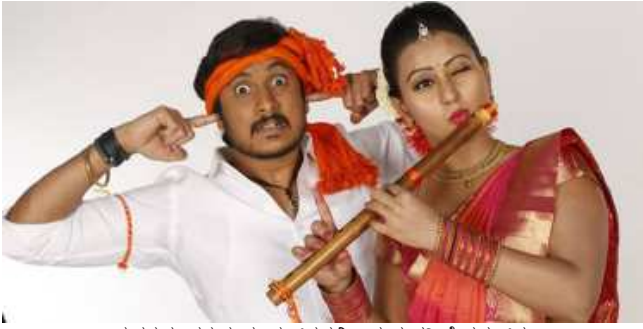
ಕೃಷ್ಣರುಕ್ಕು ಕನ್ನಡ ಚಲನ ಚಿತ್ರದಲ್ಲಿ ಬರುವ ಸನ್ನಿವೇಶದ ಚಿತ್ರ.