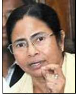
ಮುಖ್ಯಮಂತ್ರಿ ಮಮತಾ ಬ್ಯಾನರ್ಜಿ