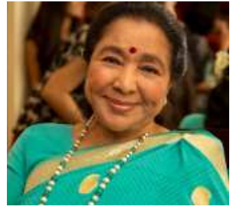
ಗಾಯಿಕೆ ಆತಾ ಬೋಸ್