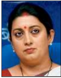
ಸ್ವತಿಇರಾನಿ, ಕೇಂದ್ರ ಸಚಿವೆ