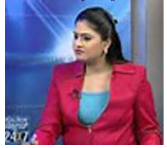
ಪಬ್ಲಿಕ್ ಟಿವಿ ನ್ಯೂಸ್ ರಿಡರ್ ರಾಧಾ ಹೀರಗೌಡರ್