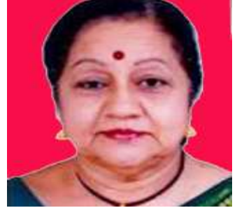
ಲೇಖಕಿ ಆರಂಭ ಪಟ್ಟಾಭಿ