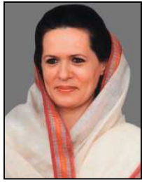
ಸೋನಿಯಾಗಾಂಧಿ, ಎಐಸಿಸಿ ಅಧ್ಯಕ್ಷಿ