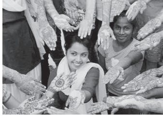
ಮಹಂದಿಯನ್ನು ವಿದ್ಯಾರ್ಥಿನಿಯರು ಕೈಗೆ ಹಚ್ಚಿಕೊಂಡು ಪ್ರದರ್ಶಿಸುತ್ತಿರುವುದು