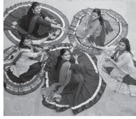
ಮಹಿಳೆಯರ ಸ್ವತ್ವದ ಒಂದು ಭಂಗಿ