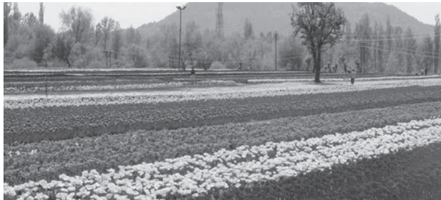
ಹೂತೋಟದ ಅಂದವ ಚಿತ್ರ