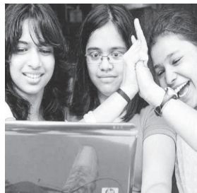
ವಿದ್ಯಾರ್ಥಿನಿಯರು ಕಂಪ್ಯೂಟರ್‌ನ ವಿಷಯದಲ್ಲಿ ಚರ್ಚಿಸುತ್ತಿರುವುದು.