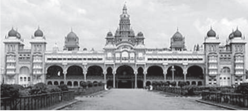
ಜಗದ್ವಿಖ್ಯಾತ ಮೈಸೂರು ಅರಮನೆಯ ದೃಶ್ಯ