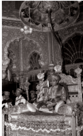
ಮೈಸೂರು ಅರಮನೆಯಲ್ಲಿನ ಯುವರಾಜರ ಖಾಸಗಿ ದರ್ಬಾರ್‌ನ ಕೆಲವು ದೃಶ್ಯಗಳು