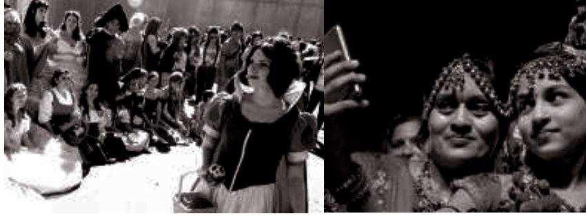
ಮಹಿಳಾಮಣಿಗಳು ಕಾರ್ಯಕ್ರಮವೊಂದರ ಸಿದ್ಧತೆಯಿಂದ ಕೂಡಿರುವ ಹಾಗೂ ಸೆಲ್ಫಿ ದೃಶ್ಯಗಳು