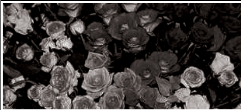
ಗುಲಾಬಿ ಹೂಗಳ ಅಂದವೇ ಅಂದ ನೋಡಲು ಬಲು ಚೆಂದ